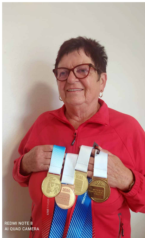
REDMI NOTE 8 AI QUAD CAMERA